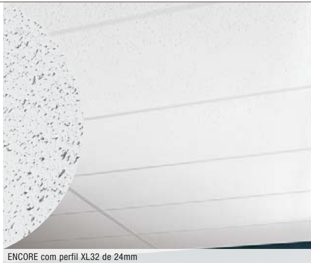
ENCORE com perfil XL32 de 24mm

Para informações sobre Créditos LEED, enviar um email para infobrasil@armstrong.com.br